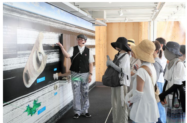
図6 見学ツアー風景

ツアー終了時には多くの回で自然と拍手が起こり、来場者が技術への理解と共感を深めていることを実感した。