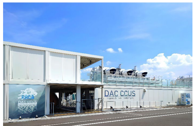
図1 RITE 未来の森全景

大気中 CO 2 直接回収)を中心とした DAC-CCUS (Carbon dioxide Capture, Utilization and Storage)の実証・展示を通じ、これらの先端技術を来場者にわかりやすく伝え、理解を促した。