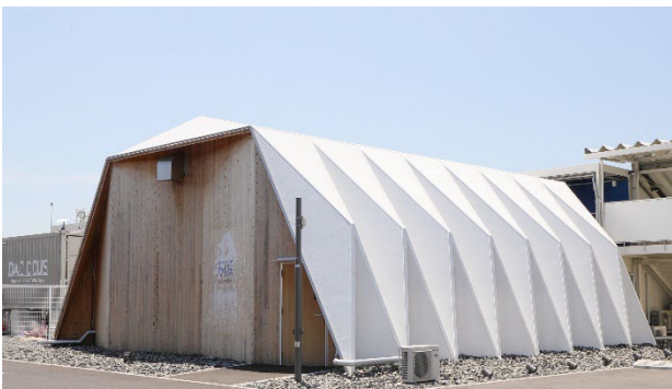
図4 ガイダンスホール

来場者が最初に訪れるガイダンスホールは CLT(直交集成板)折版構造を用いた木造建築で構成され、持続可能な建築技術を体現する存在となった。この建物は、構造設計の革新性と環境配慮が評価され、国際的に評価の高い iF DESIGN AWARD 2026 や 2025 年ウッドデザイン賞を受賞している。建築そのものが持続可能性の象徴となっている。