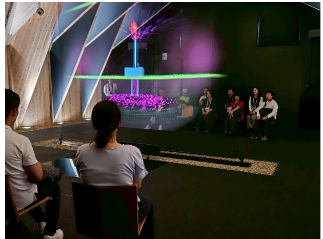
図5 ガイダンス映像

ホール内では、ゴーグルを用いずに立体視が可能な最新の映像技術を活用し、約 12 分間の映像コンテンツを上映した。この映像は、産業革命以降の地球の炭素循環の変化と地球温暖化の進行、そしてその解決策としてのネガティブエミッション技術の役割をわかりやすく描いたガイダンス映像であり、来場者が見学前に全体像を把握できるよう構成した。続く見学ツアーをより深く体験するための導入となった。