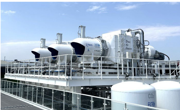
図2 DAC 装置

第一に、NEDO ムーンショット型研究開発事業の一環として、RITE 化学研究グループが行った DAC 装置の実証試験である。DAC 装置を実際に稼働させ、大気中から直接 CO 2 を回収する様子を来場者に公開した。同事業に参画する名古屋大学・九州大学の DAC 装置も併せて公開し、各機関の技術を一堂に紹介した。ネガティブエミッション技術が実在し、実用段階に近づいていることを実機稼働によって示した点は、本展示の最大の特徴である。