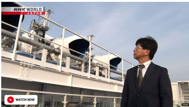
図7 NHK WORLD JAPAN「INPACTS Climates Change the World」放映

TV15件、新聞78件、雑誌・WEBメディア27件の合計120件のメディア掲載があった。また、SNSでも多くの投稿があった。これにより、DACを中心としたネガティブエミッション技術とRITEの認知度向上につながった。