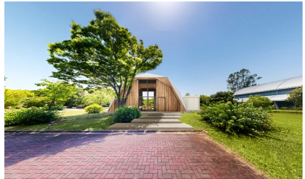
図9 移設イメージ図

ガイダンスホールは万博終了後、RITE本部へ移設され、万博出展のレガシーを共有・継承する場として活用する予定である。さらに、RITEの学びと成長を支える場としての可能性も追求していく計画である。