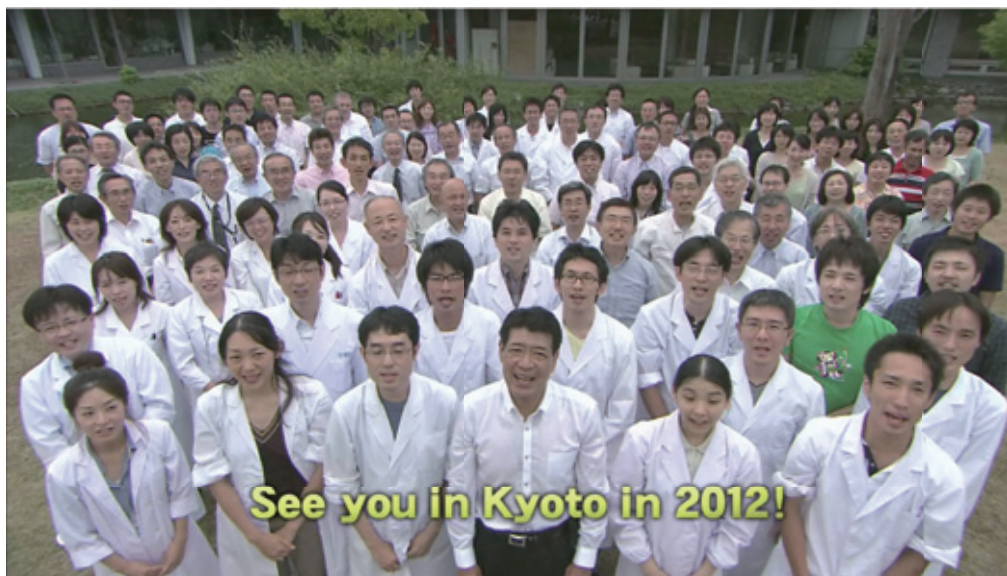
GHGT-11 インビテーションビデオ