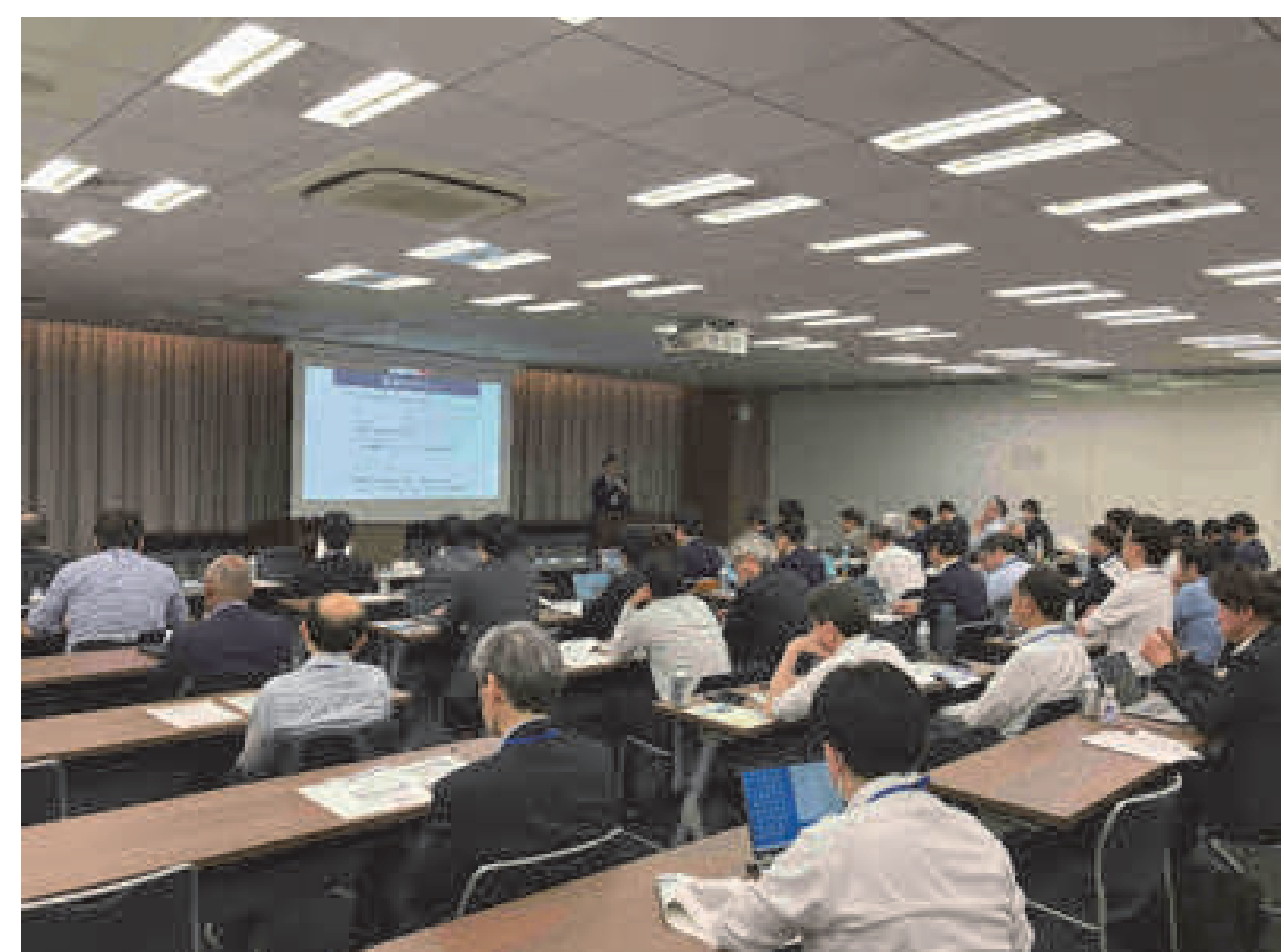
会員限定セミナー