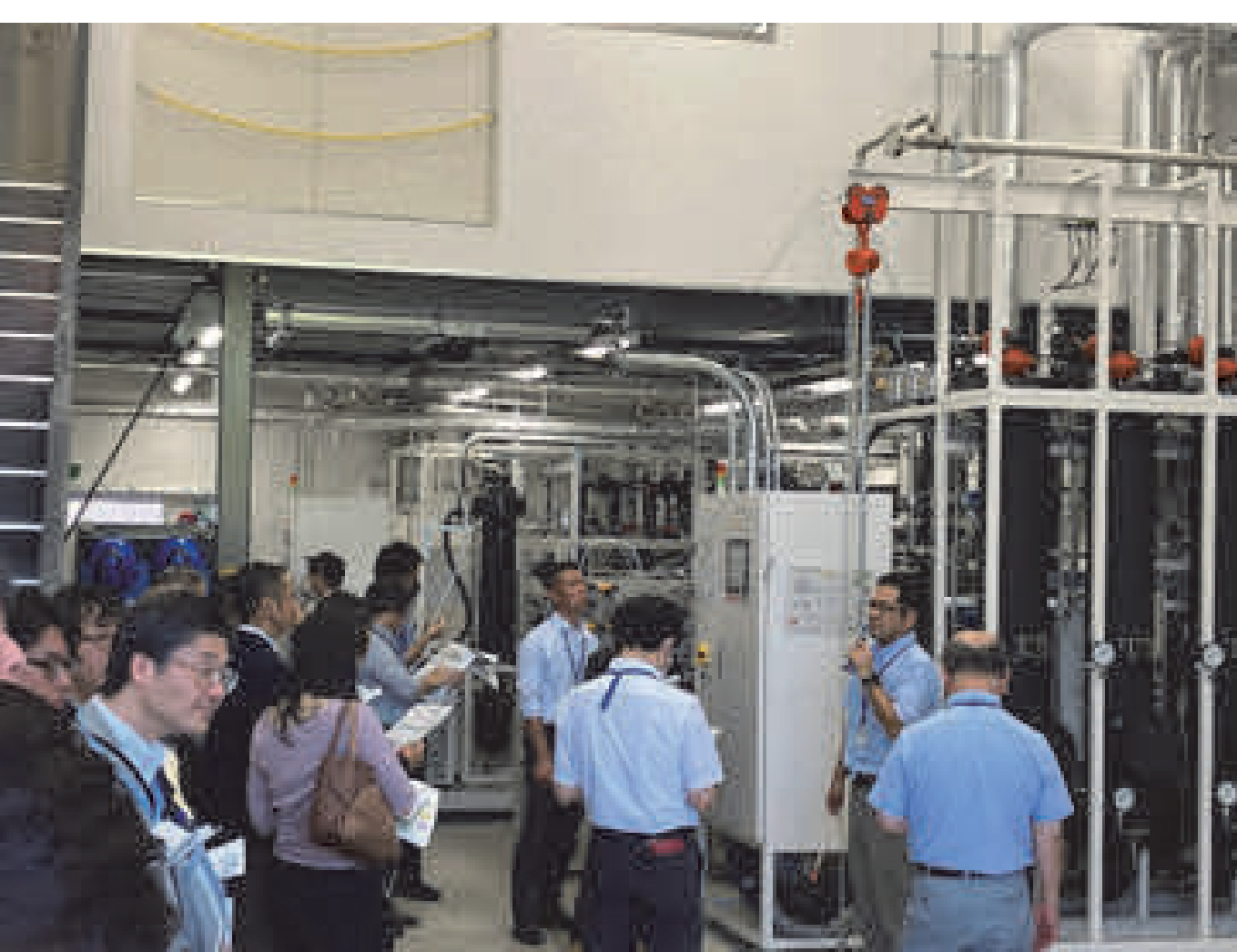
見学会 (RITE RCCC)