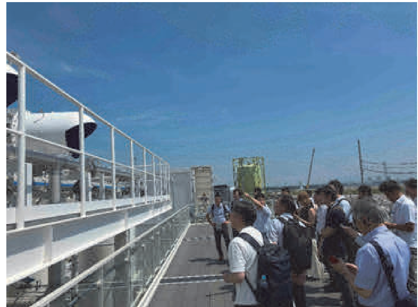
RITE未来の森見学会 (大阪・関西万博)