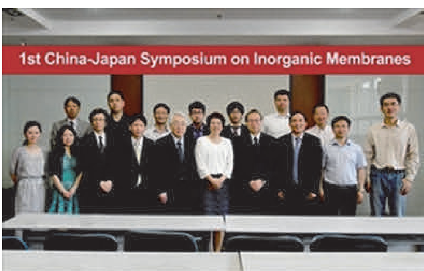
海外調査活動(南京工業大学)